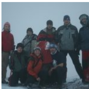
Na szczycie Midžura – ekipa w komplecie