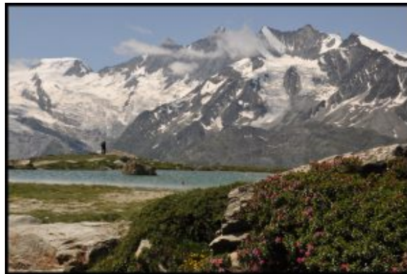
Widoczki na drodze zejściowej do Saas Grund

Ten wyjazd był dokładnie taki, jaki miał być. Fletschhorn już na wstępie zignorowałem i przez to na niego nie wszedłem. Następnym razem podejść do planowania nieco bardziej ambitnie. Chociaż z drugiej strony: 2 i pół dnia w górach i 2 i pół zdobytych szczytów – to chyba niezły wynik.