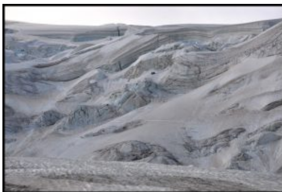
Lodowiec pod Weissmies, częściowo widoczna ścieżka oraz jedna z grup na lodowcu