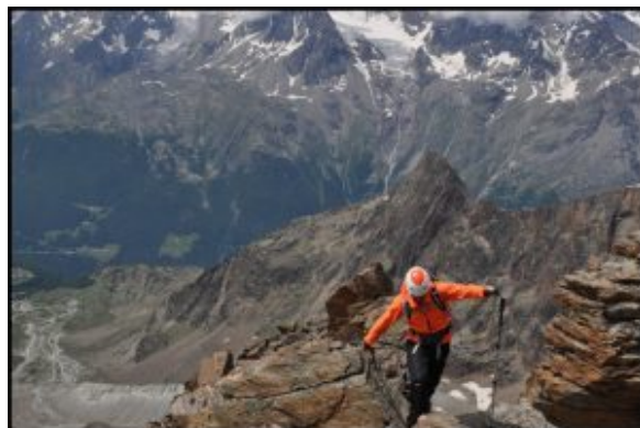
Na zachodniej grani Lagginhorna