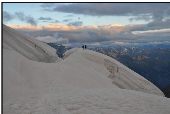
Piotrek i Łukasz na podejściu na Weissmies