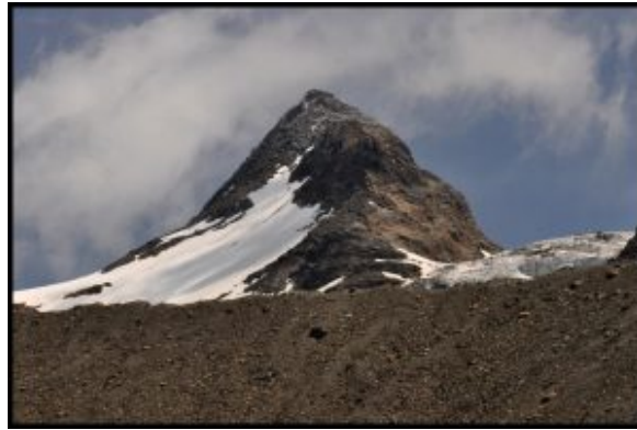
Fletschhorn (3993 m n.p.m.) – jeden z najładniejszych „prawie czterotysięczników”