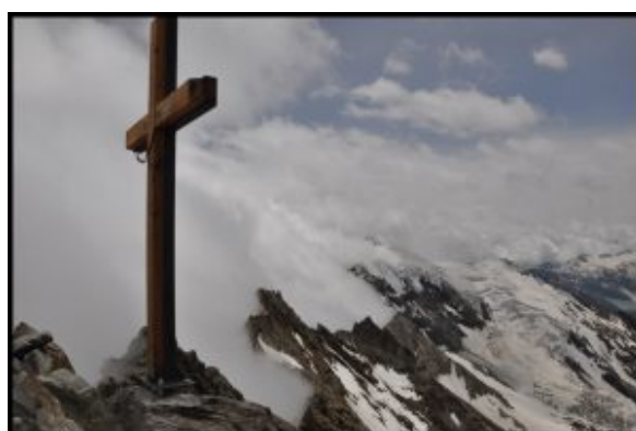
Lagginhorn – 4010 m n.p.m.