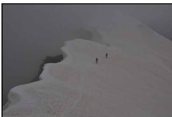
Piotrek i Łukasz na grani Weissmies