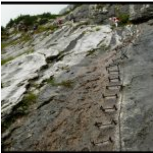
Kłamry na początku ferraty.