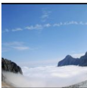
Panoramka z lodowca.

Dziku'2016: Poniżej relacja z sierpnia 2007 roku. Zugspite był moim 7-mym szczytem Korony Europy, lecz pierwszym położonym w