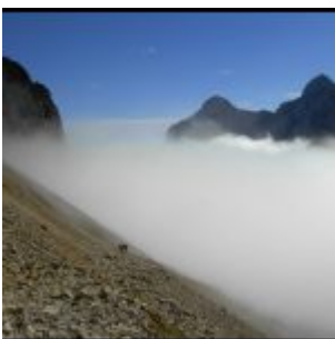
Po wyjściu na piarżyska.