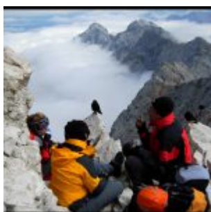
Dobre miejsce na rodzinne pogaduszki.