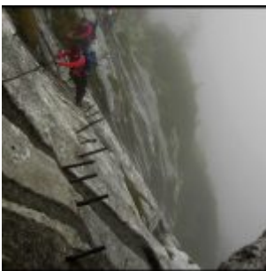
Stalowe pręty na trasie.