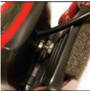
Śrubka, przewód i gąbeczka

3. Regularnie rozregulowujący się pasek załatwiłem ustawiając jego długość raz i blokując pasek w klamercie.