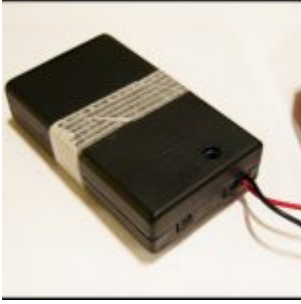
Pojemnik na baterie za grosze