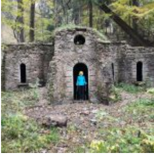
Atrakcje na szlaku. Nie jedyne!