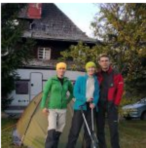
Zdjęcie pamiątkowe po powrocie ze szlaku