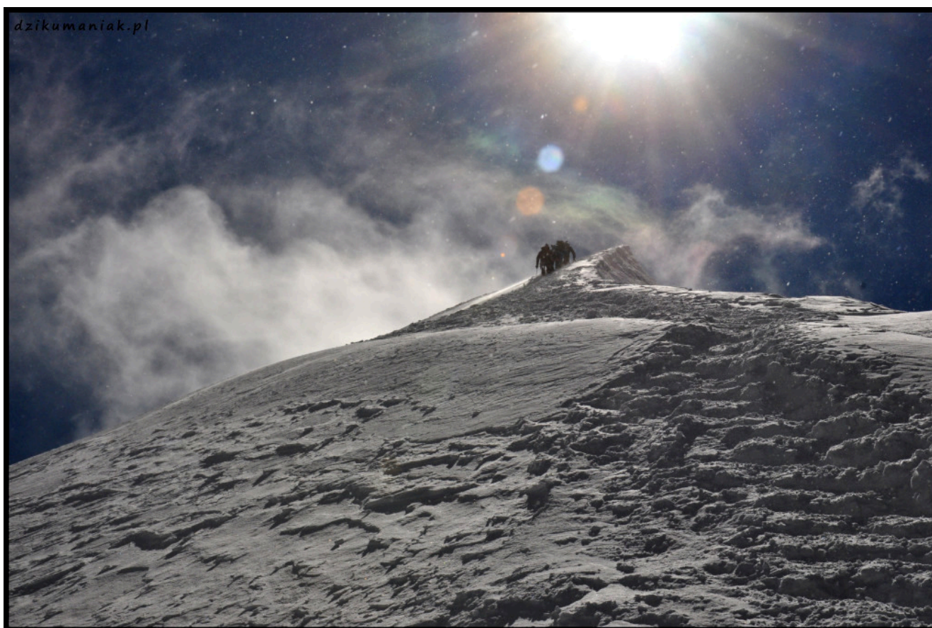
Dom (4545) – pod samym szczytem