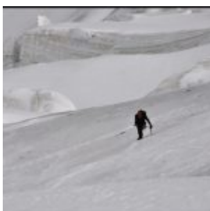
Tomek na Festigrat prowadzącej na Dom